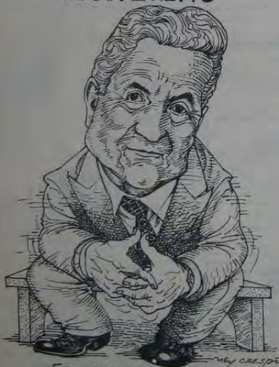
FOI UMA PENA, A SUA MORTE.