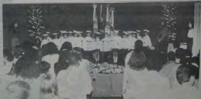
Flagrante do Hino Nacional