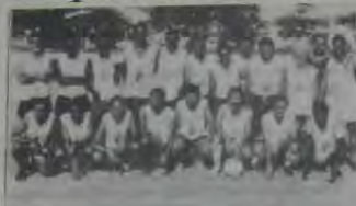
O time de veterano do Rola Cançada FC foi campeão em Iraja