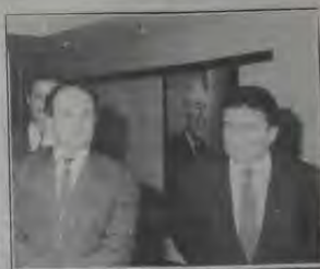
O governador do Distrito Federal, Cristovam Buarque, (E) corentes da ambientação do conjunto Ecomunitário do LBU em Brasília, acompanhado pelo Legionário Enalido Viana.

O Governador do Distrito Federal, Cristovam Buarque, esteve conhecendo o Templo da Boa Vontade e o Parlamento Mundial da Fraternidade Ecomunitária - o Parlamento da LBU -, em Brasília.