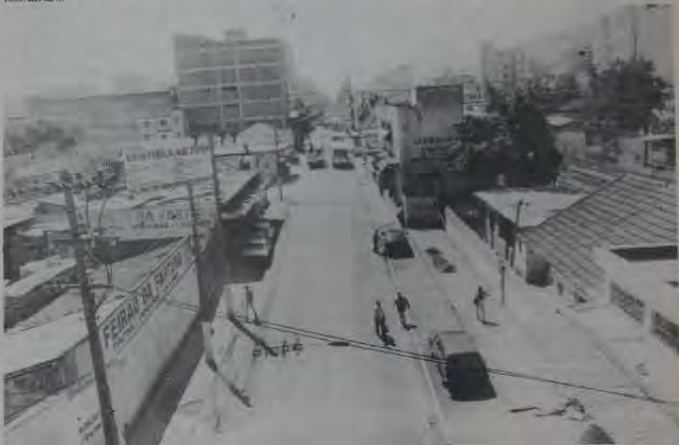
Pelo menos na Av. Marechal Floriano, o objetivo central de toda mudança verificada no trânsito de Nova Iguaçu, o volume de veículos apresentou sensível redução nesta primeira semana de experiência.