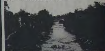
Chatuba: bairro piloto de Nova Iguaçu. Esta imagem vai mudar

No encontro, que deu início a uma série de reuniões periódicas, foram apresentados os principais objetivos do Programa Baixada Viva e as responsabilidades dos municípios e do Estado do Rio no processo. A partir dessas reuniões, começam a ser estabelecidos convênios para execução do programa e para operação e manutenção dos equipamentos e unidades do Baixada Viva.