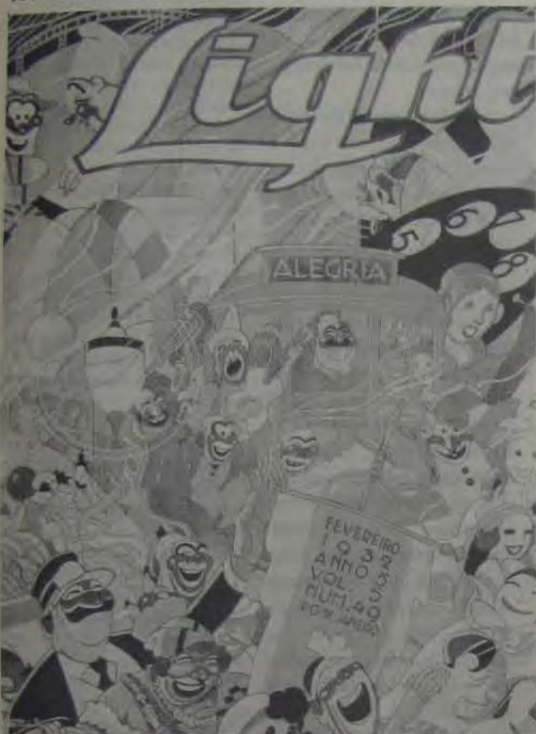
Ilustração de J. Carlos - Revista Light

Centro Cultural Light: Avenida Marechal Floriano Peixoto, 168 - térreo, Centro do Rio de Janeiro - RJ