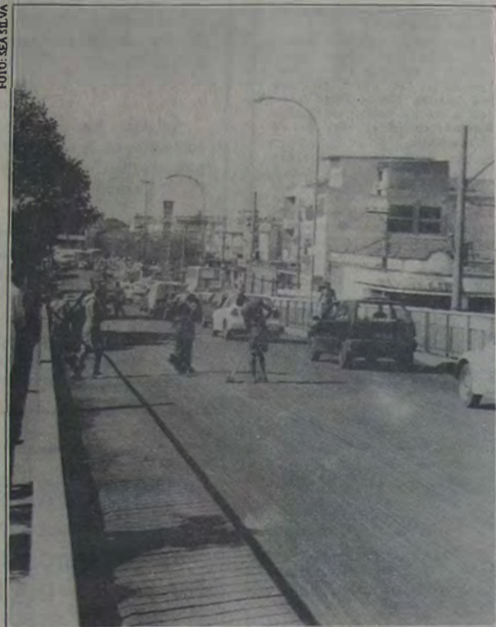
As obras no viaduto de Mesquita, esta semana, tumultuaram o trânsito em toda cidade, resultado de falta de divulgação do cronograma de obras de reparo nas principais artérias do perímetro urbano.