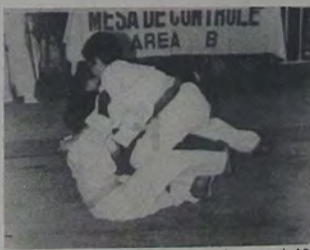
O Festival começa com os judocas até 12 anos.

Em março, os professores de Judô da Baixada, em reunião acontecida no Núcleo Regional, aprovaram a realização do primeiro evento de 97, o Festival de Judô que será realizado em três etapas. No próximo dia 20 acontece a primeira etapa - para os atletas até 12 anos - na Academia Walter Russo, em Duque de Caxias, a partir das 9 horas. A segunda etapa será dia 26, na Academia César Romeu - no centro de Nova Iguaçu - nas categorias pré-juvenil e juvenil, com início previsto para as 14 horas. A Associação Ligu de Judô, situada no Parque Flora (Nova Iguaçu), estará sediando a terceira fase do festival, dia 27, a partir das 9 horas, nas categorias Júnior e Sênior.