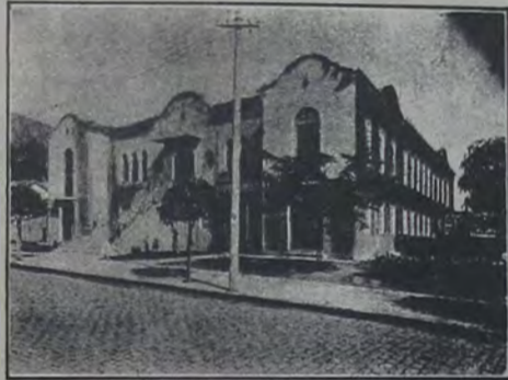
O magestoso edifício do Hospital de Iguassú

Um dinamismo realizador foi o característico da actual administração. Para confirmar essa asserção, citaremos dentre muitas, as seguintes obras públicas executadas — construção de novas estradas de rodagem, calçamento a paralelepípedos das principais ruas; colocalção