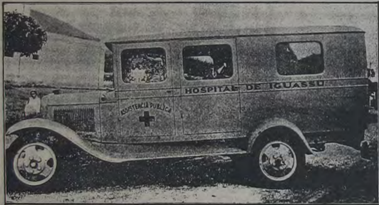
A ambulancia do Hospital de Iguassú, que tem prestado relevantes serviços á nossa população

A obra, porém, que avulta em seu governo, entre as primeiras, collocando-o na categoria dos benemeritos deste