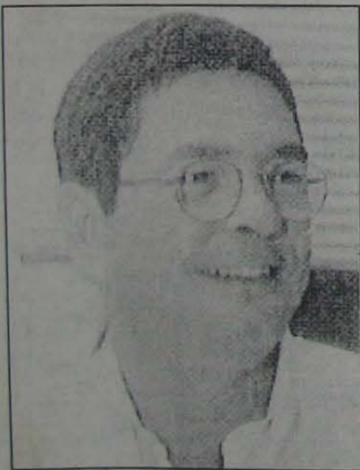
FABIO G. RAUNHEITTI Deputado Estadual

São 82 anos - gloriosos 82 anos - noticiando os fatos mais importantes da história de Nova Iguaçu, com precisão e seriedade. Por este motivo, nós não poderíamos deixar, nesta data tão significativa, de nos associarmos às comemorações de tão importante jubileu, que tanto dignifica e enaltece os iguaçuanos.