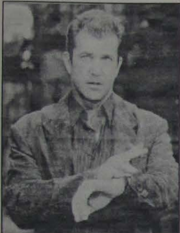
"O Troco" (lançamento desta semana nos cines Top 2 e Center 1). Mel Gibson vive o anti-herói Porter, que busca vingança