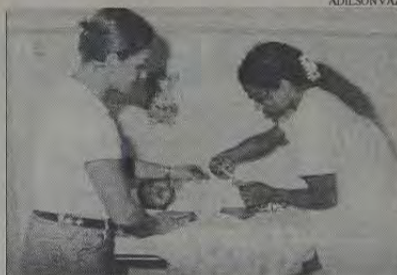
A vacinação contra a Hepatite B em Belford Roxo está mobilizando toda a população, que tem comparecido com assiduidade aos postos de atendimento.

A Hepatite B é uma infecção provocada por