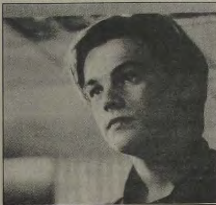
Leonardo Di Caprio é o astro de "A Praia" em cartaz nos cinemas Center 1 e Iguaçu Top 1.