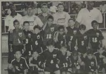
O time fraldinha do Esporte Clube Iguaçu.

Na categoria Mirim o Esporte Clube Iguaçu conquistou