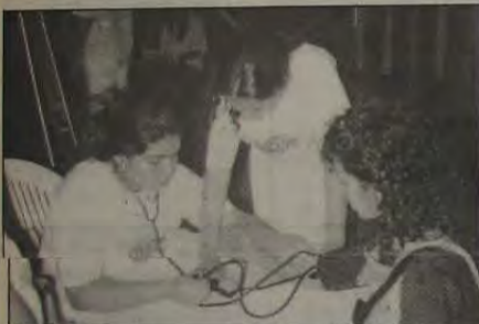
Uma aluna medindo a pressão arterial.