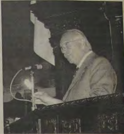
O presidente do TRE manifestou o rigor do Tribunal na fiscalização de toda a propaganda para as eleições de outubro.