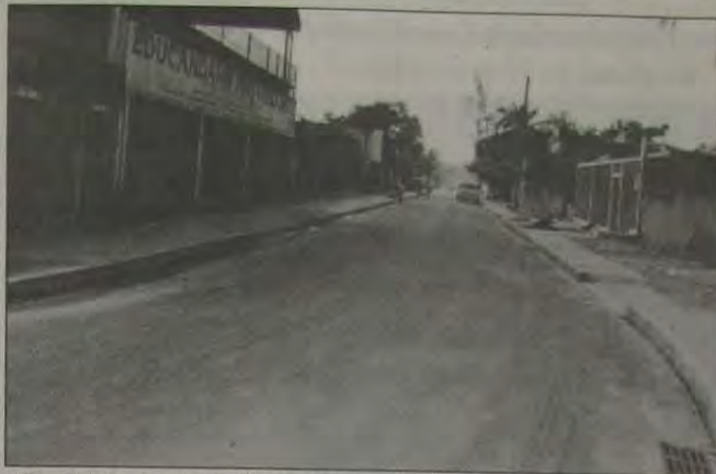
A Rua Espinhares, no Bairro São José, foi saneada, drenada e pavimentada.