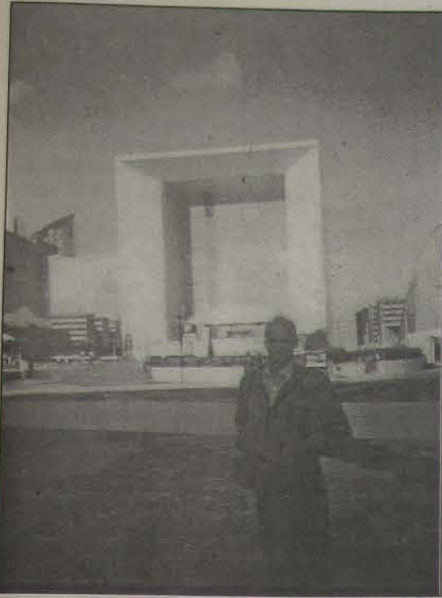
3 - Irio no Grand Arche de La Defense.