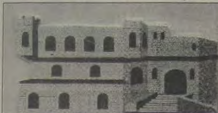
Salões, porão e calabouço do castelo serão palco do RGB: Vampiro