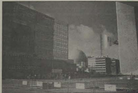
4 - La Defense.