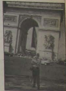
9 - Irio junto ao Arco do Triunfo.