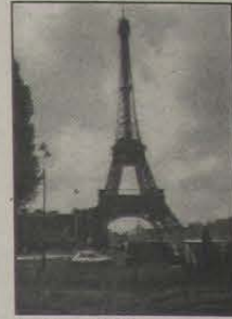
8 - Torre Eiffel.