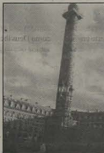
5 - Place Vendôme, onde se concentram as relojoarias mais caras de Paris e onde fica o famosíssimo Hotel Ritz.