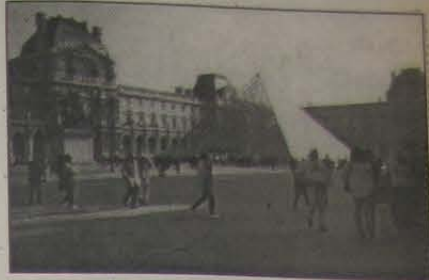
7 - Museu do Louvre. Reserve um ou dois dias para ver tudo.