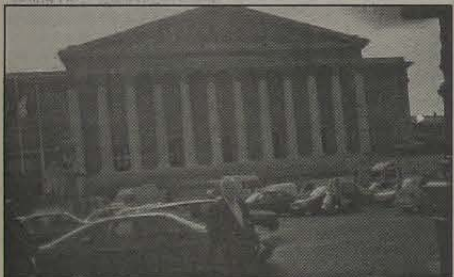
2 - A Assembléia Nacional.