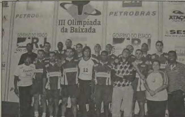
A seleção de Nilópolis, campeã do handebol masculino da Baixada.

Valendo pela última etapa da 3ª Olimpíada da Baixada Fluminense, o handebol foi a atração do último domingo, dia 25, realizado no ginásio da Vila Olímpica de Duque de Caxias.