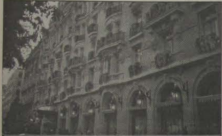
1 - O famoso Hotel Plaza Athenée.