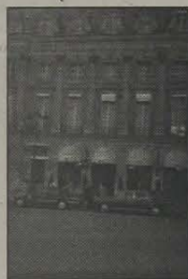
6 - Fachada do Hotel Ritz.