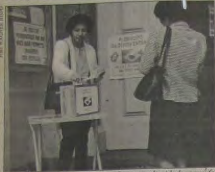
De todas as urnas espalhadas pelo centro da cidade, a que foi colocada na entrada da Catedral certamente foi a que recebeu o maior número de votantes.