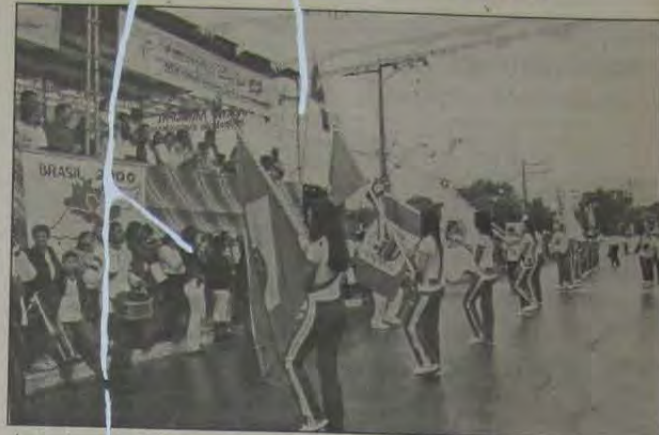
A primeira etapa do desfile cívico-escolar em Queimados realizou-se na Estrada dos Caramujos, onde foi instalado o palanque oficial.

A E.M. Prof. Scintila Excel fez a abertura do desfile, que foi encerrado pelos alunos do Projeto Transformar, onde, através de uma parceria com a FIRJAN, o governo municipal alfabetiza jovens entre 15 e 19 anos. A emoção ficou por parte dos alunos de Educação Especial da E.M. Vereador Carlos Pereira Neto. "Podemos ser até diferentes em alguns momentos, mas, temos força de vontade para aprender. Todos nós somos iguais perante Deus. Precisamos do seu carinho e de sua atenção", esta foi uma das mensagens