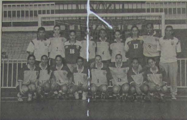
A Seleção Brasileira de Handebol juvenil feminino.

No último final de semana, a Seleção Brasileira de Handebol (feminino) esteve em Nova Iguaçu, onde deu prosseguimento à sua fase preparatória visando a participação no Campeonato Mundial, este ano.