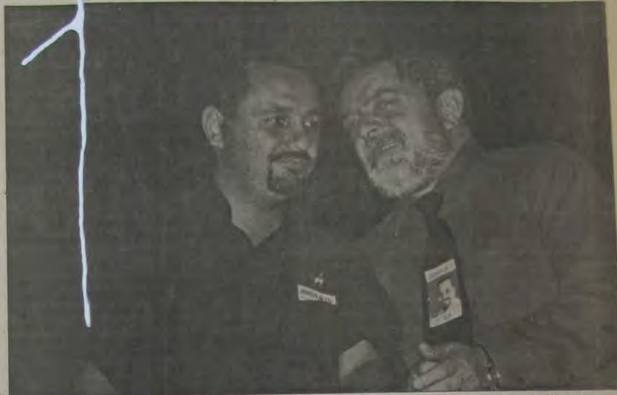
A vinda de Lula a Nova Iguaçu culminou a grande agitação promovida pelos militantes do PT no Calçadão.

"Chova o que chover, a Prefeitura é do PT". Foi com este bordão que a militância do PT cantou debaixo da chuva de quarta-feira, dia 6, à noite, esperando pelo seu representante maior, o presidente de honra do Partido dos Trabalhadores, Luiz Inácio da Silva, o Lula.