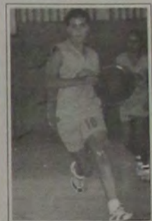
O basquete feminino está voltando ao cenário esportivo iguaçuano.