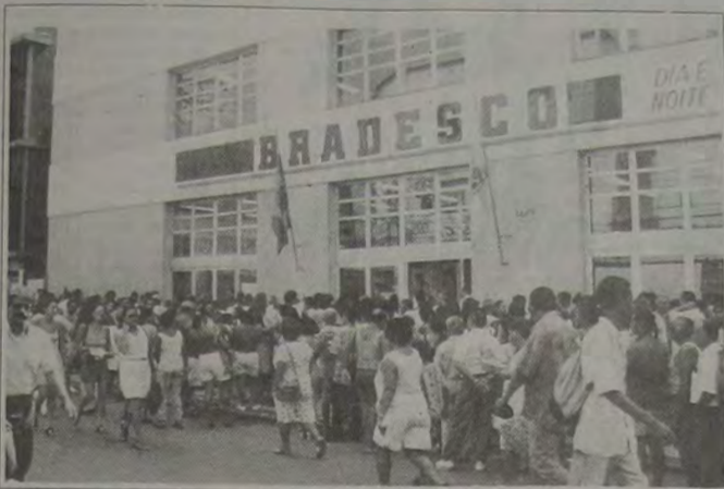
O Bradesco, chancelado como o "banco do pavão", oferece aos seus milhares de clientes um péssimo atendimento.