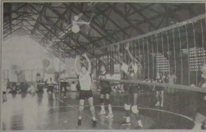
O vôlei reunirá equipes tradicionais, como o IESA e o CE Califórnia.

Boas novas para o esporte estudantil iguaçuano na próxima temporada: as escolas municipais, estaduais e particulares terão a oportunidade de disputar a maior competição estudantil da região. A organização ficará a cargo da Liga de Desportos de Nova Iguaçu e deverá contar com a participação de mais de dois mil alunos.