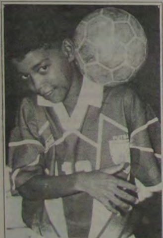
Canequinho, um dos melhores atletas desta temporada.

Na edição do dia 15 de dezembro, a Sportmídia divulgará o atleta vencedor da votação, que ganhará uma recordação inesquecível por sua atuação na temporada. Dê o seu voto, participe!