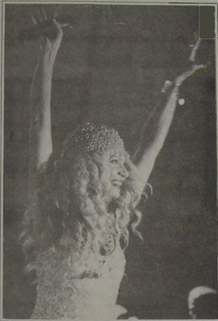
Como sempre, Elba Ramalho levou ao delírio a pequena multidão que lotou a Praça dos Eucaliptos, na grande festa de comemoração do 11º aniversário de emancipação de Queimados.

A Praça de Alimentação com cerca de 630 m² reservou um espaço para cerca de 70 barraqueiros que aproveitaram para vender comidas típicas. Era possível encontrar carnes salgadas, apim, batidas e até mesmo picanhas na brasa. Nem mesmo o vinho podera faltar. Uma adega com queijos e vinhos de todos os tipos de cerca de 6 metros foi montada na Praça. Para reser-