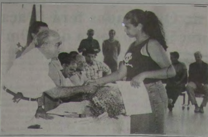
O prefeito José Paixão entrega o primeiro certificado de participação no programa Bolsa Escola a uma das mães beneficiadas.

Em solenidade realizada dia 11, na nova sede da Caixa Econômica Federal, no centro de Nova Iguaçu, o prefeito José Paixão fez a entrega dos primeiros cartões do programa "Bolsa Escola", criado pelo Governo Federal e estabelecido em parceria com a Prefeitura de Mesquita, através da Secretaria de Educação local.