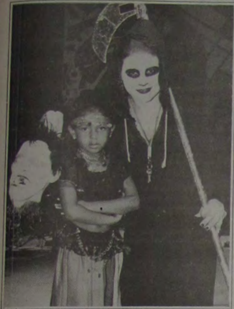
Vários concursos de fantasias vão ocorrer durante o tríduo momesco em Queimados.

Já estão abertas as inscrições para os interessados em montar suas barracas na Praça de Alimentação para o Carnaval de Queimados, que acontecerá no Espaço Cultural da cidade (antiga Praça dos Eucaliptos), a partir do dia 8 de fevereiro. A Praça de Alimentação, com cerca de 630m 2 está reservando um espaço para cerca de 60 barraqueiros. A taxa é de R$ 279,74 por uma barraca de 3x3m pelos quatro dias de evento. A inscrição pode ser feita no Departamento de Fiscalização da Prefeitura, na Rua Zelina Pinto, nº 36, centro, Queimados, de segunda a sexta-feira, das 8 às 17 horas.