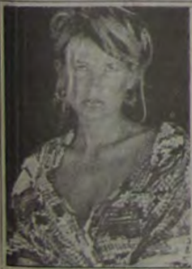
"Xuxa e os duendes" em cartaz nos Cines Verde 2 e Top 2

● IGUAÇU TOP 1 - "O Senhor dos anéis" (3ª semana). Um filme de Peter Jackson, com Elijah Wood e Cate Blanchet. Censura: 12 anos. Horário: 13h30m - 16h40m - e 20 horas.