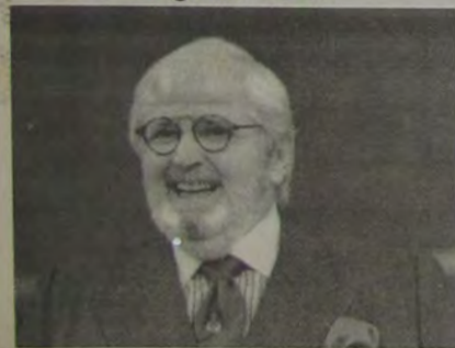
No mês de janeiro o Programa do Jô está exibindo as melhores entrevistas de 2002. É o repeteço de Verão.