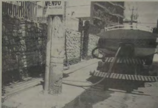
Os carros-pipa estão sempre presentes na Rua Dr. Mário Guimarães, para suprir os moradores de um fornecimento d'água que é da inteira responsabilidade da CEDAE.