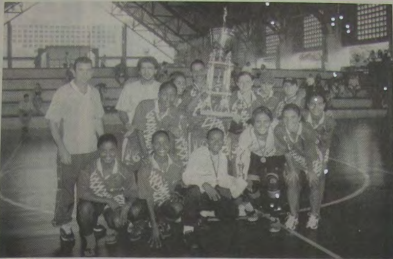
A equipe de futsal do Colégio Percepção é uma das melhores do Rio de Janeiro.