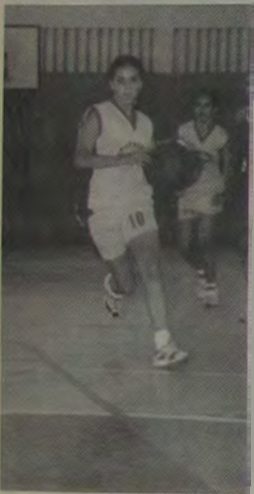
Na história esportiva do Colégio Leopoldo, o basquete sempre mereceu atenção especial do tradicional estabelecimento de ensino de Nova Iguaçu.

O projeto é destinado para meninos e meninas, na faixa etária dos 6 aos 16 anos. As aulas começarão a ser ministradas a partir da primeira semana de março. O Ginásio de Esportes do Colégio Leopoldo fica na Rua Bernardino de Melo, 1074, Centro, Nova Iguaçu.