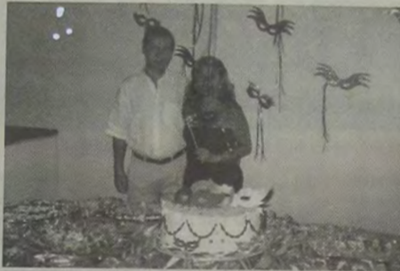
Durante um baile de máscaras