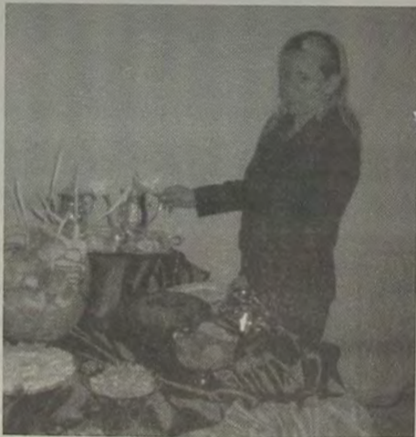
Durante tarde de chá