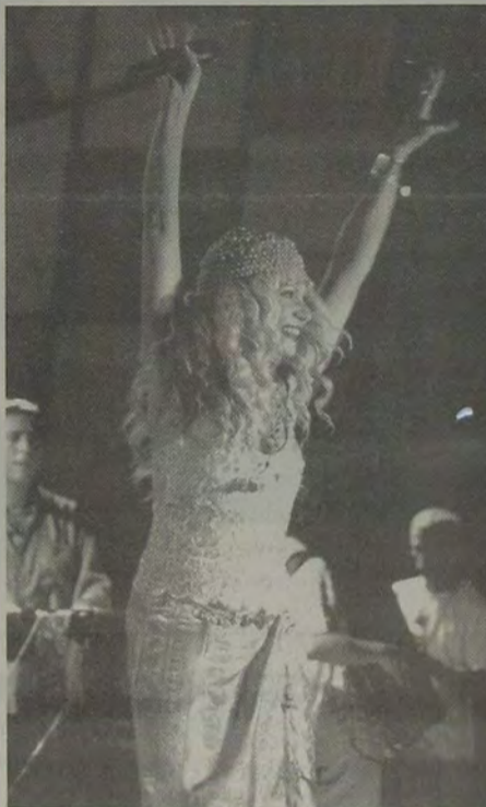
Elba Ramalho é uma das estrelas da música popular brasileira que já esteve em Queimados, no Carnaval, e que até hoje exalta o melhor tríduo momesco da Baixada.

Bloco Rola Estressada, entre outros. Observadores irão escolher e premiar os grupos mais animados, o maior grupo, a fantasia mais original e o folião destaque. Também haverá premiação para a barraca mais bonita.