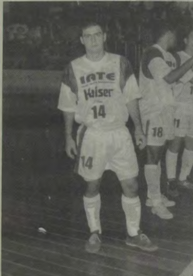
Vander Carioca poderá ser uma das atrações da 1ª Copa Nova Iguaçu de Futsal.