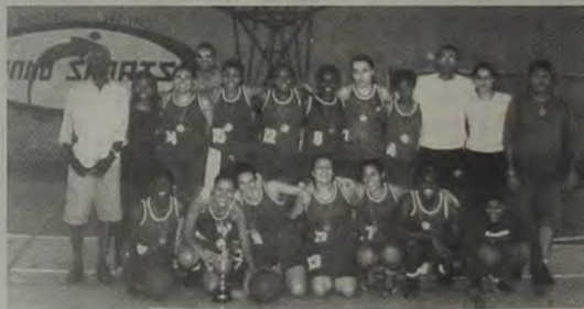
A nova equipe de basquetebol feminino do Colégio Leopoldo.

O grupo de atletas que jogará pelo Colégio Leopoldo pertencem à extinta equipe feminina juvenil de Duque de Caxias.