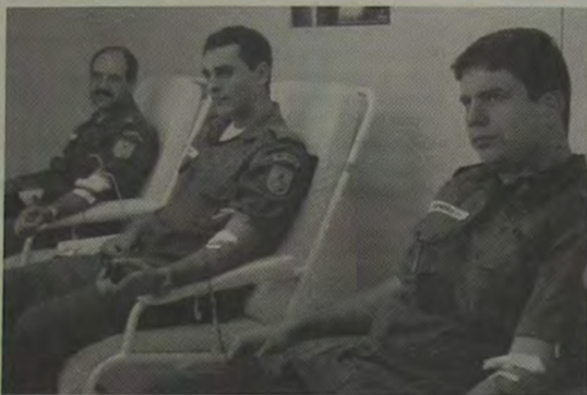
Oficiais do 20º BPM participaram da campanha de doação de sangue.