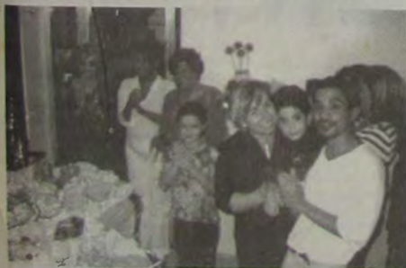
Álbum de família na hora do bolo e do parabéns