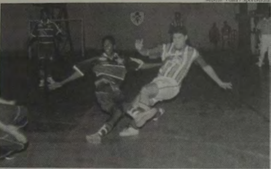
Além do talento, o Paracambi/Hosp Rio terá que ter muita garra para derrotar o Barra Mansa na Copa Rio Sul.