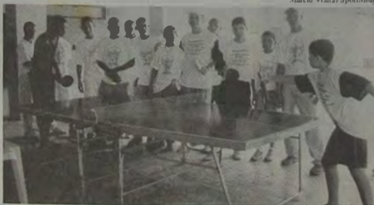
O Tênis de Mesa tem inúmeros adeptos na Baixada Fluminense.

Com um excelente nível técnico, teve início no Nilópolis Square, neste último final de semana, uma super competição de Tênis de Mesa, contando com o apoio do Curso de Inglês CNA/Nilópolis, que registrou 150 atletas inscritos nas categorias Infantil e Livre para não federados.