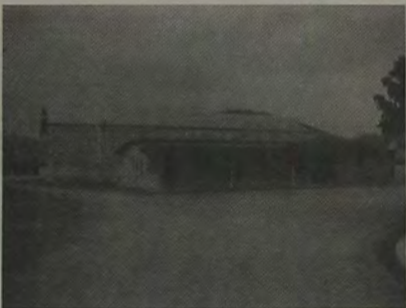
A intensa programação vai de 9 às 17 horas de hoje.

Certidão de nascimento, casamento e até atestado de óbito, além de carteira profissional, cédula de identidade e outros documentos pessoais poderão ser obtidos gratuitamente a partir das 9 horas da manhã deste sábado, dia 12, durante a realização do programa "Chega mais comunidade", que estará acontecendo nas dependências do Clube Órica, da Explo do Brasil, em Vila de Cava.