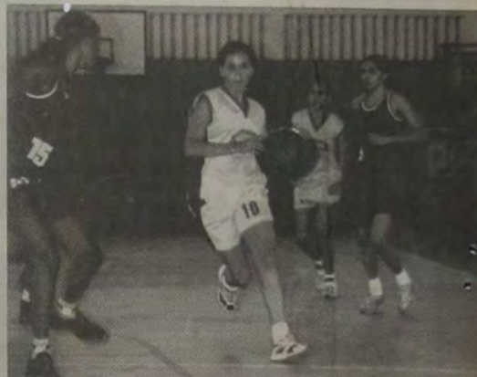
O Colégio Leopoldo, Belford Roxo/Lisam e o Instituto Brasil entram no Movimento Olímpico em disputa do título de Basquete (feminino).