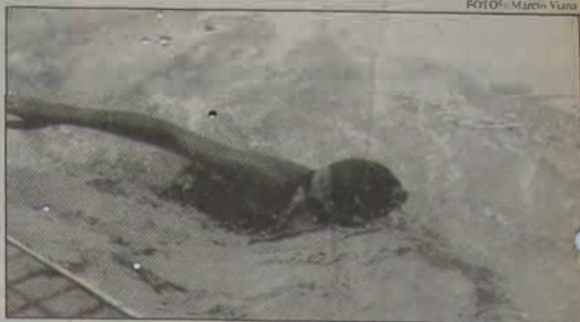
As equipes de natação da Baixada lutarão pelo título no IV Movimento Olímpico.