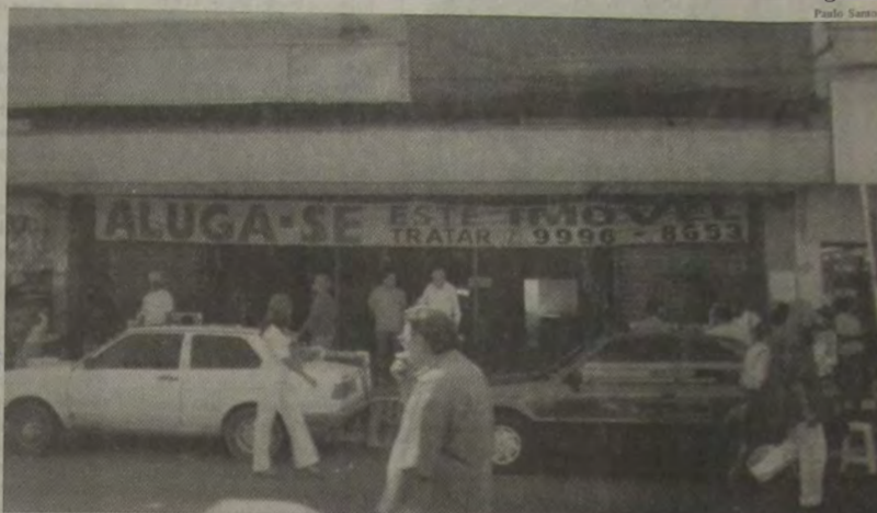
A loja da Casas Franklin, tradicional estabelecimento especializado na comercialização de tecidos, fechou as portas no endereço localizado entre a Travessa Mariano de Moura e a Rua Dom Walmor.