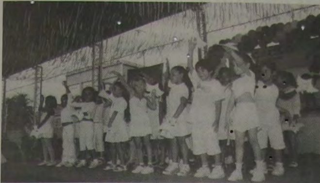
Alunos do pré-escolar se apresentaram durante a solenidade de inauguração das obras de reforma da Escola Municipal Monteiro Lobato.

O prefeito Mario Marques incluiu as obras de reforma na Escola Municipal Monteiro Lobato, que foram inauguradas festivamente no último sábado, na agenda positiva de sua administração. Mario enfatizou que o Monteiro Lobato recebeu a maior intervenção ao longo de sua história, iniciada em 1948, e que hoje mantém a tradição de ser uma escola de referência na educação em Nova Iguaçu. O Chefe do Executivo anunciou que todas as escolas municipais serão reformadas até o final de seu mandato. Ele aproveitou ainda para fazer um ligeiro balanço dos seus 15 meses de governo, que estavam sendo comemorados no sábado.