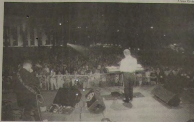
O show de Guilherme Arantes, no pátio em frente à Prefeitura, reuniu, no último domingo, cerca de 5 mil pessoas.

Alguns dos momentos mais românticos da MPB passaram como um filme na memória de quem assistiu ao show de Guilherme Arantes, no último domingo, no Paço Municipal. Pela primeira vez em Nova Iguaçu, o cantor emocionou as cerca de cinco mil pessoas que foram ao Paço com os maiores sucessos de seus 27 anos de carreira. O espetáculo faz parte do projeto Música Nova Iguaçu, da Secretaria Municipal de Cultura e Turismo, que promove um grande show de MPB por mês na cidade, sempre com a participação de um artista local. Quem abriu a noite do último domingo foi o músico iguaçuano Sérgio Tarquino.