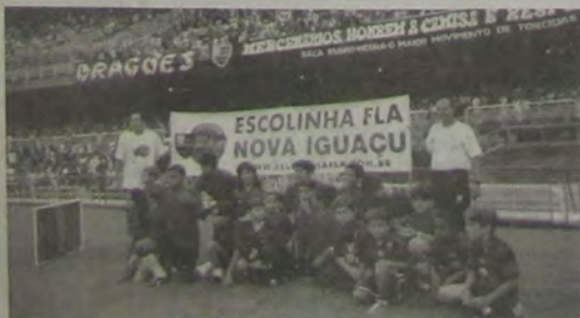
Os alunos da escolinha do Flamengo participam da entrada tradicional do time profissional, nos jogos realizados no Maracanã.

Os interessados em obter maiores informações sobre a Escolinha do Flamengo poderão se dirigir à sede do Horizonte, situada na Rua Themis, s/nº, Carmari, Nova Iguaçu.