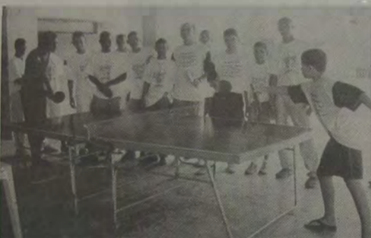
O tênis de mesa será uma das modalidades que contará com o maior número de participantes no IV Movimento Olímpico.