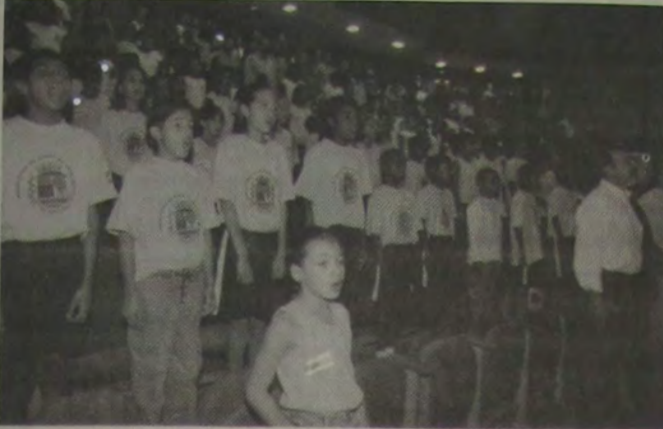
O Programa de Erradicação das Drogas entregou certificados a 240 alunos da rede municipal que fizeram parte do projeto.