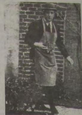
Sellers mantém a alta técnica da tradicional escola teatral inglesa, sobretudo nesta interpretação da figura simplória de um jardineiro cujo universo resumia-se numa telinha de tv.