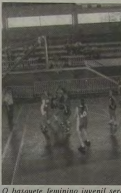
O basquete feminino juvenil será disputado pelas equipes do Belford Roxo/Lisam, Colégio Leopoldo, Instituto Brasil e CR Caxiense.