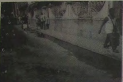
Um pequeno córrego, de água cristalina, corre rente à sarjeta para mergulhar num bueiro (semi-assoreado) que fica na esquina da Bernardino Mello com a Sebastião Herculanô de Matos.