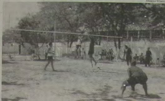
O vôlei de areia sub-20 reunirá dezesseis duplas, femininas e masculinas, totalizando os 32 melhores jogadores da Baixada.