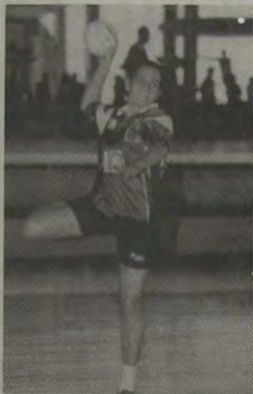
O handebol feminino adulto reunirá as quatro melhores equipes da Baixada Fluminense.