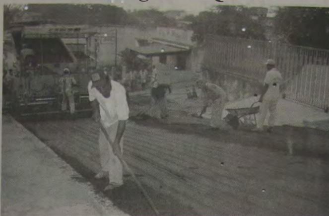
Obras de reapecamento da Rua Alves, principal via de entrada para o Bairro da Caixa D'água.

O Bairro da Caixa D'água, próximo ao Centro de Queimados, está recebendo obras de drenagem, saneamento, canalização de águas servidas (rede de manilha específica para águas das chuvas), pavimentação e passeio público (calçadas) na Rua B (principal via do Bairro). A Rua Alves, que liga o bairro ao Centro da cidade, também recebeu obras de reapecamento. Ainda estão sendo providenciados pela Secretaria de Obras, redutores de velocidade de veículos, já que as ruas são muito inclinadas. Segundo o Secretário de