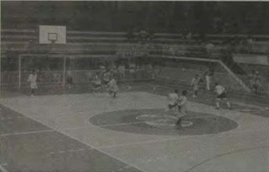
O futsal, que é um dos esportes mais praticados na Baixada, será disputado nas categorias Mirim (masculino) e Juvenil (feminino).