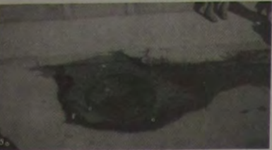
Este registro jorra água em abundância, dia e noite, bem em frente ao prédio da Cruz Vermelha

Este vazamento existe desde dezembro do ano passado e fica em frente ao prédio (antigo casarão da Família Matos) da Cruz Vermelha, na Rua Bernardino Mello. A CEDAE esteve no local, olhou, olhou e nada resolveu, como de hábito. Segundo moradores da área, no local não está faltando água, mas o vazamento, logicamente, deve estar prejudicando outras moradias.