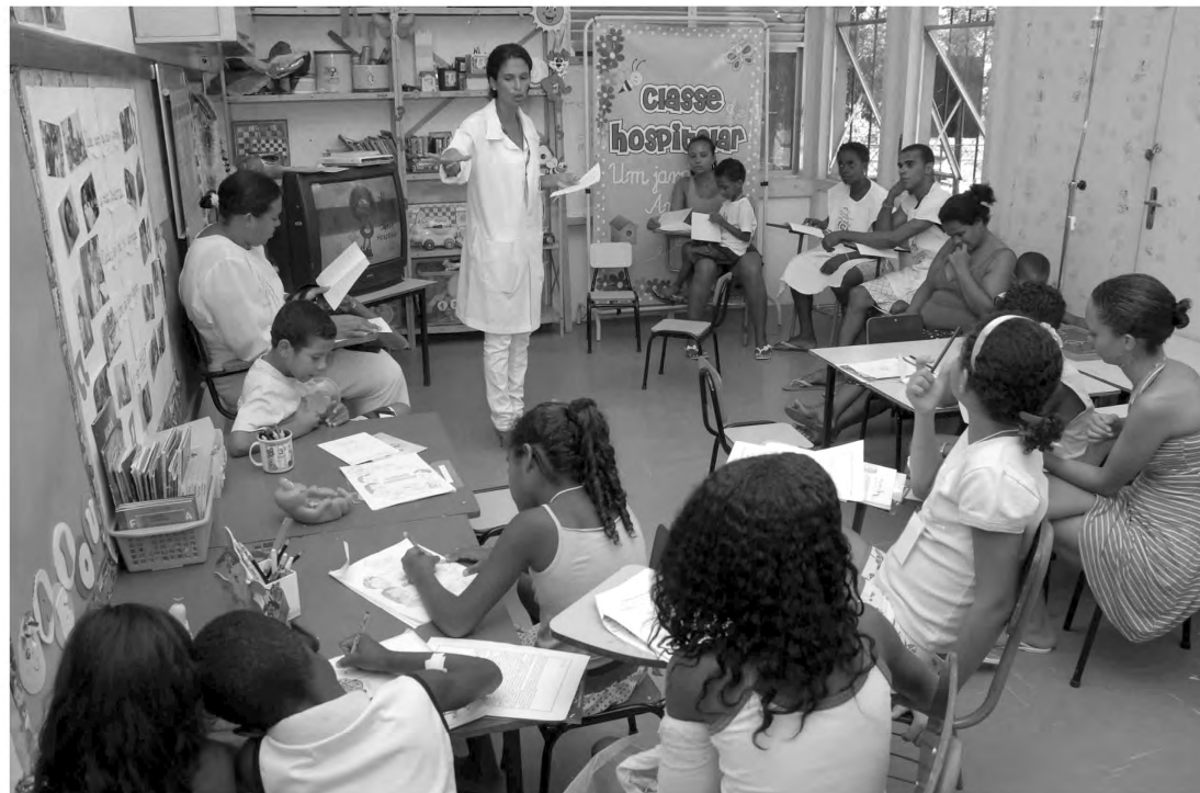
A Pediatria do Hospital da Posse virou, desde a última segunda-feira (22), uma grande sala de aula. O projeto Classe Hospitalar, visa levar às crianças internadas no Hospital, as atividades dadas em sala de aula

Pequenos pacientes são incentivados a estudar numa sala de aula montada na Pediatria