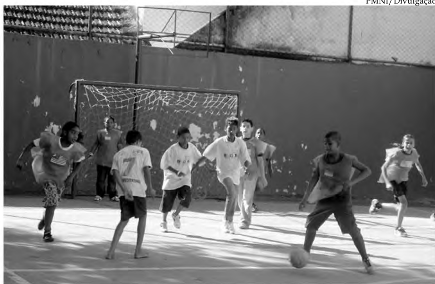
A Seleção da Costa do Marfim foi a grande vencedora do torneio de queimada na Escola Municipal Profa. Irene da Silva Oliveira, em Vila de Cava

As escolas municipais de Nova Iguaçu continuam apostando na Copa na África do Sul. Em Vila de Cava, os alunos da Escola Municipal Profa. Irene da Silva Oliveira escolheram as seleções de Portugal e Coréia do Sul para disputar com a Seleção Brasileira. Além do futebol, o jogo de queimada também mobilizou os estudantes. Nesta categoria, o resultado não foi favorável para o time brasileiro. A vantagem ficou com a Costa do Marfim, que tirou a vitória de Portugal na disputa da última terça-feira (22). Já a final do futebol da "Copa Irene 2010", que seria disputada na última quinta-feira, dia 24, foi adiada por causa da chuva.