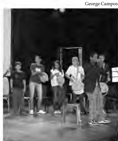
Alunos da Escola Livre de Música cantaram o hino da cidade