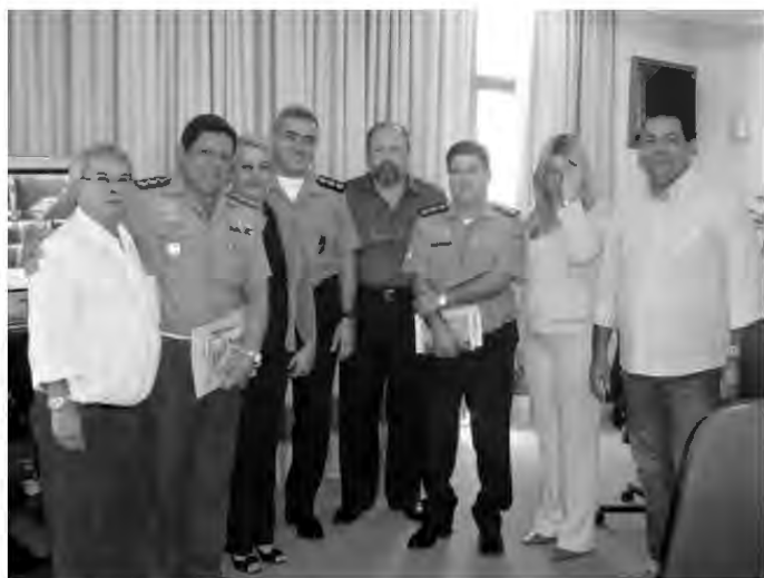
Representantes de várias instituições da cidade de Nova Iguaçu estiveram presentes na reunião para discutir a segurança pública