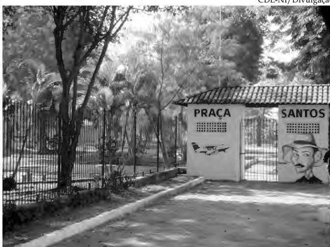
A Praça Santos Dumont, no centro da cidade de Nova Iguaçu mostra que está faltando alguma coisa. Talvez seja a presença de uma Guarda Municipal

PQC - Programa de Qualificação do Comércio Almoço Interativo da CDL-NI tem palestra sobre Marketing Pessoal