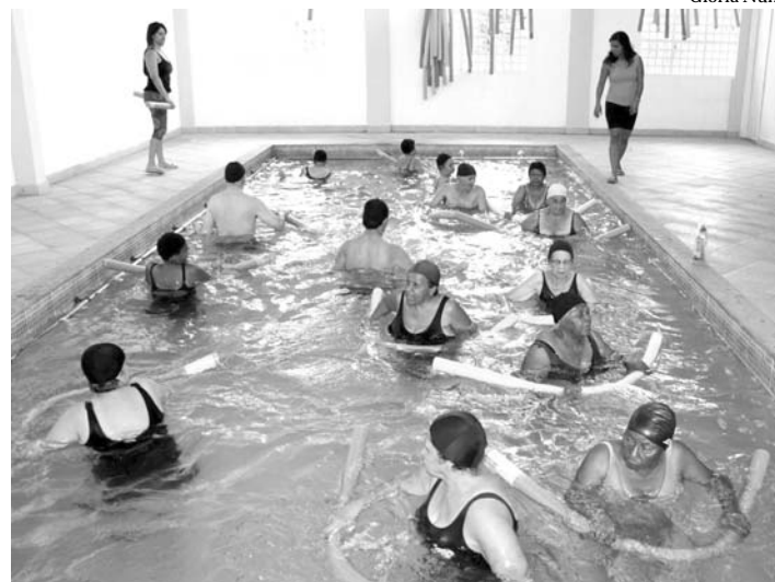
Aula de hidroterapia no ESMUTI

Os encontros, com três horas de duração, serão realizados uma vez por mês, no período de março a novembro. Os debates são organizados pela secretaria adjunta de Atenção Básica, através da Coordenação do Programa de Atenção Saúde do Idoso, e têm o objetivo de melhorar a qualidade de vida na terceira idade. A idéia é que as discussões, entre outros aspectos, possam estimular a participação dos