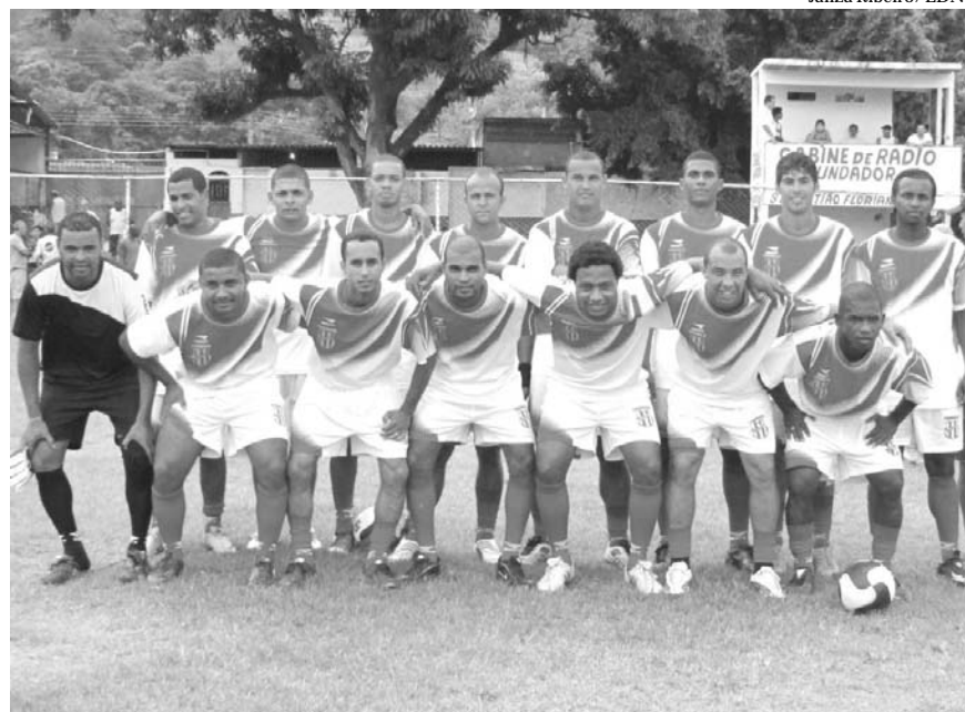
A equipe do Unidos do Cobrex lidera a Chave B do Torneio de Verão