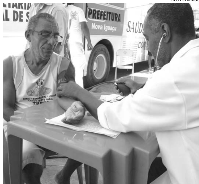
No ônibus itinerante são realizadas ações preventivas de saúde

Itaipu, s/nº, Vila Santo Antônio; Quarta-feira (dia 2) – Rua Italiana, nº 75, Carlos Sampaio; Quinta-feira (dia 3) –