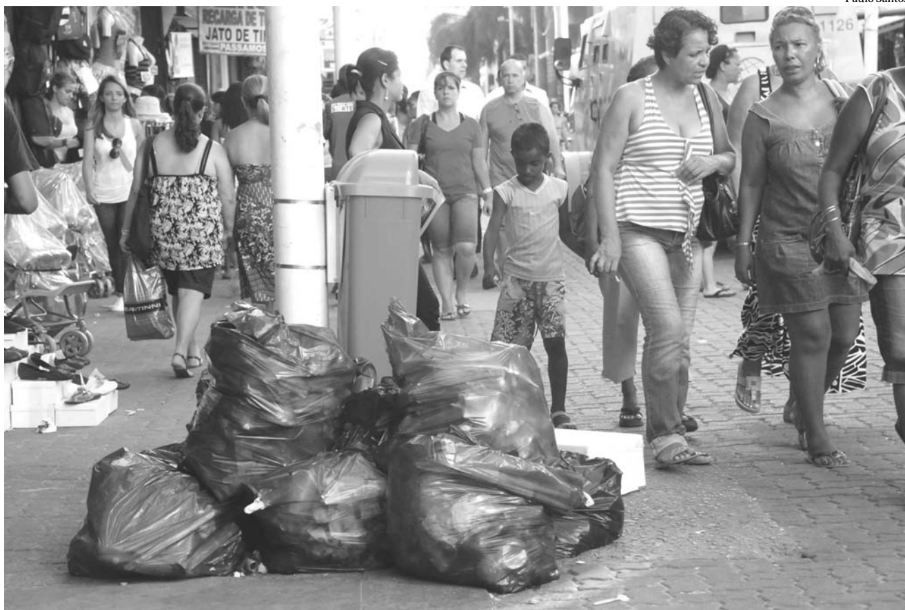
No Calçadão, centro nervoso de Nova Iguaçu, os sacos de lixo se amontoam em frente as lojas, atrapalhando o trânsito de pedestres

Assim acontece no Calçadão de Nova Iguaçu. Basta caminhar nas primeiras horas da manhã para ver a limpeza que contrasta com a sujeira no fim do horário comercial. Pedestres reclamam das caixas de papelão abandonadas por ambulantes e das canas jogadas na rua pelos donos de lanchonetes.