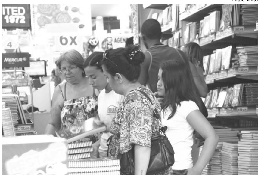
A expectativa de vendas de material escolar, para as papelarias, é de 20% a mais em relação ao ano passado