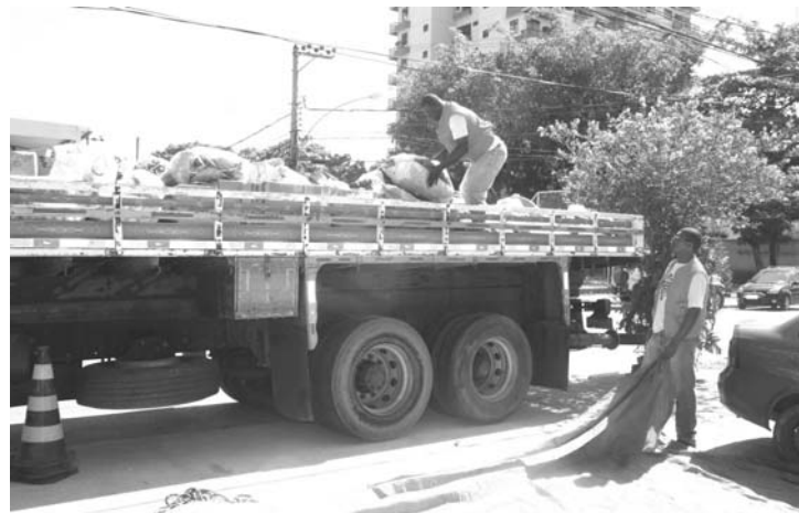
Agentes da Defesa Civil preparam caminhão com doações para a Região Serrana