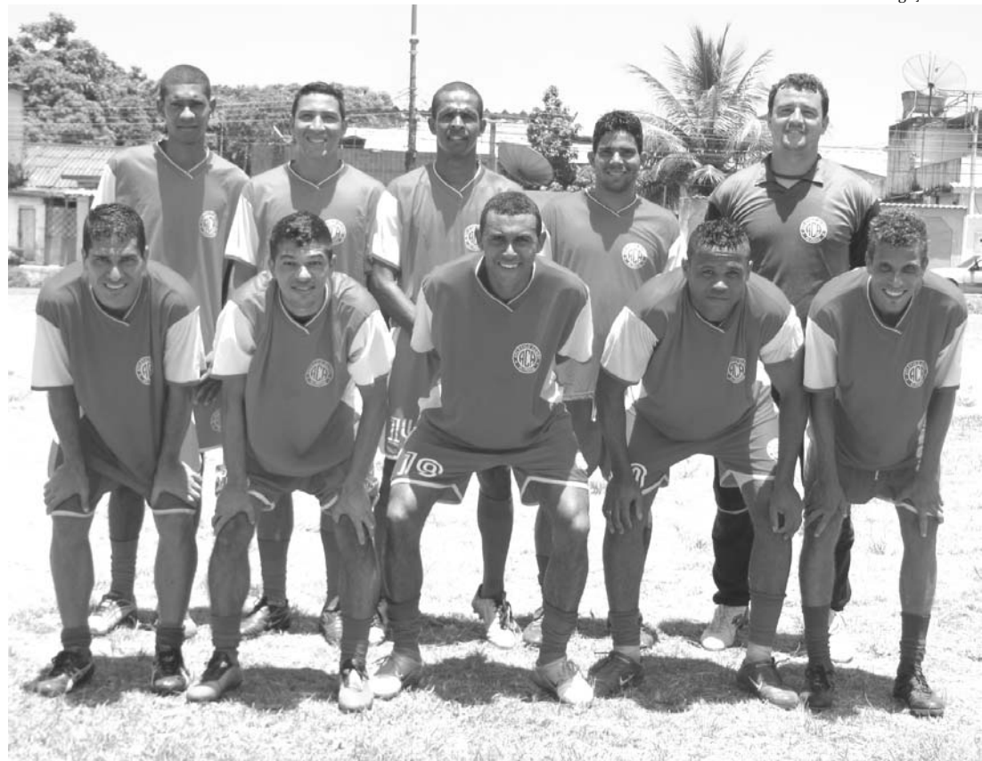
A equipe do Amigos joga pelo empate para chegar à semifinal do Torneio de Verão

No último domingo (27), foram disputadas as partidas válidas pelas oitavas-de-final do Torneio de Verão 2011, promovido pela Liga de Desportos de Nova Iguaçu que definiu as oito equipes classificadas para as quartas-de-final da competição.