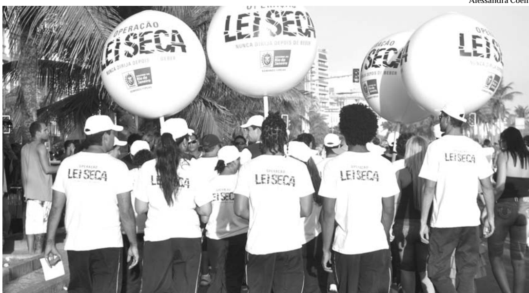
Agentes da Operação Lei Seca conscientizam foliões no bloco Simpatia é Quase Amor

A Operação Lei Seca, da Secretaria de Estado de Governo, vai mobilizar todo o seu efetivo contra a imprudência no Carnaval. O objetivo é conscientizar os foliões da importância de nunca dirigir depois de beber e, com isso, continuar reduzindo os índices de acidentes no Rio. Nos dias de festa, de sexta à terça-feira (de 4 a 8/3), serão realizadas 35 operações de fiscalização e outras 30 de conscientização em todo Grande Rio.