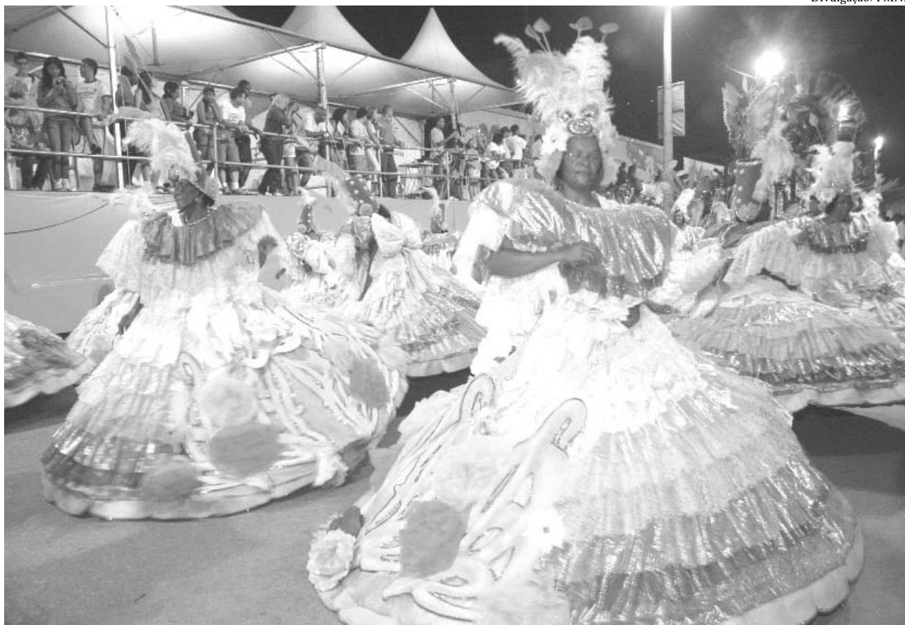
A Império da Uva foi a grande campeã do Carnaval 2010

A partir das 7h deste sábado diversas ruas do Centro serão interditadas pela Semtesp. A principal delas será a Via Light, no trecho entre a Rua Coronel Francisco Soares e a Professor Paris. Ainda neste trecho, será interditada a Rua Governador Portela. Já a Luiz de Lima ficará fechada entre a Aveni-