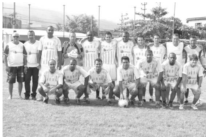
O Dois de Ouro surpreendeu e venceu a primeira no Master

O Torneio de Verão de Futebol Master teve no último domingo (27) as partidas de ida válidas pelas quartas-de-final. No Tatão, em Santa Eugênia, o Maratona foi goleado pelo Arte Trígoli pelo placar de 5 a 2, com a vitória o Arte Trígoli deu um passo im-