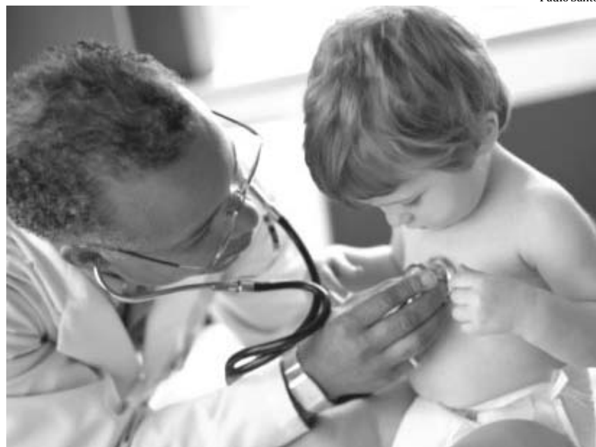
A procura pelo atendimento pediátrico transformou-se num verdadeiro calvário para as mães que se dirigem com seus filhos às unidades de saúde pública de todo o Grande Rio