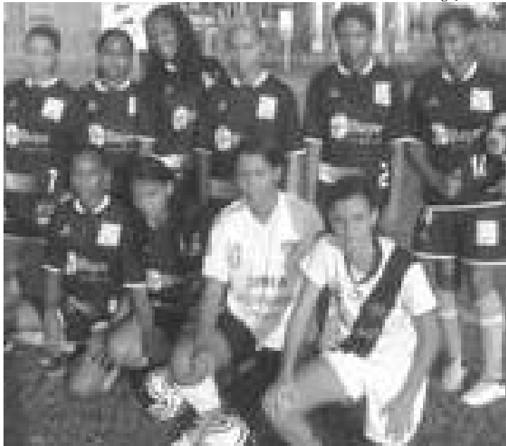
Atletas de várias equipes femininas estão ansiosas pelo início da competição

Pela Taça Cidade de Nova Iguaçu de Futebol Feminino Adulto, seis equipes confirmaram participação na com-