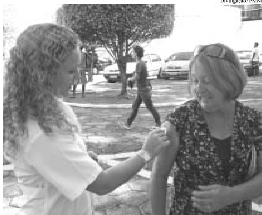
A vacina protege contra os três vírus que mais circulam nesta época do ano, inclusive o da Influenza A (H1N1)