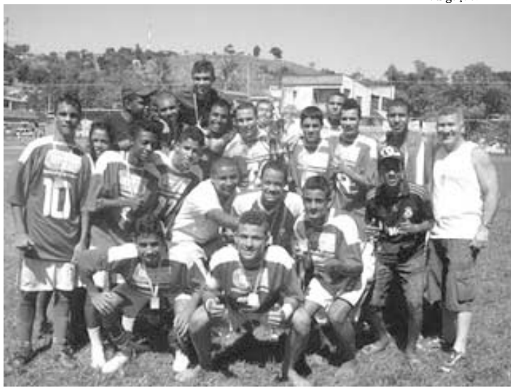
Os campeões pelo Unidos do Cobrex irão representar Nova Iguaçu no Campeonato de Seleções Municipais sub-17

Na primeira fase, com jogos de ida e volta, Nova Iguaçu terá pela frente a Seleção de Nilópolis em partidas que serão disputadas nos dias 7 de maio, em Nilópolis, e no dia 14 de maio, a partida de volta em Nova Iguaçu. Nos outros confrontos que serão disputados nos mesmos dias, Belford Roxo vai enfrentar Duque de Caxias e São João de Meriti jogará com Japeri. A Seleção