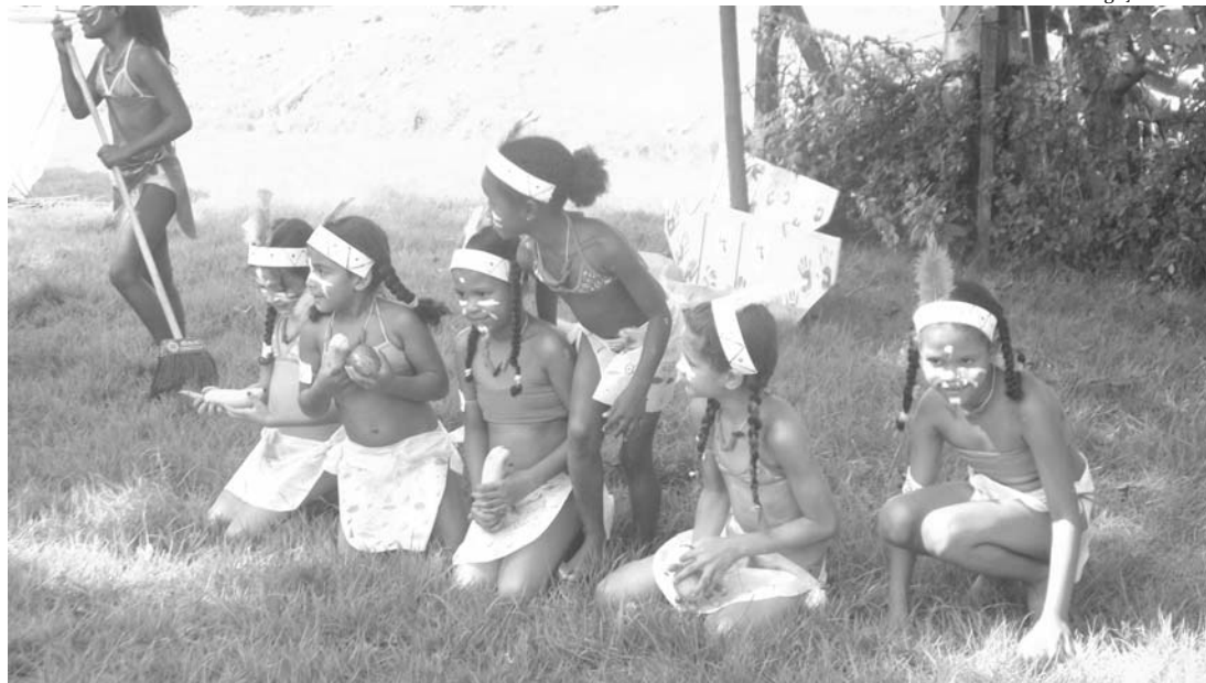
Durante as comemorações, alunos tiveram acesso à cultura indígena e ao modo de viver das tribos

A cultura indígena na sala de aula foi o tema da palestra que 60 professores da rede municipal de ensino de Nova Iguaçu participaram na última quinta-feira, dia 28. A meta da Prefeitura é orientar os educadores sobre a importância de levar para as escolas a cultura indígena, como propõe a Lei 11.645/08. O evento foi realizado no Espaço Cultural Sylvio Monteiro e faz parte da proposta pedagógica da Secretaria Municipal de Educação.