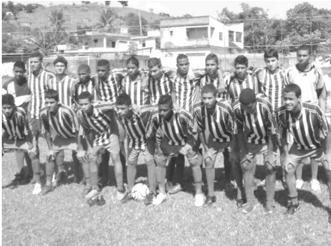
Seleção de Nova Iguaçu preparada para a estreia no Campeonato Estadual

O Campeonato Estadual de Seleções Municipais sub-17 promovido pela Federação de Futebol do Estado do Rio de Janeiro (FERJ) terá seu início neste sábado com a realização das partidas válidas pela primeira fase. A competição este ano foi dividida em 10 regiões com a Seleção de Nova Iguaçu estando na Região Metropolitana/Baixada Fluminense ao lado de Queimados, Nilópolis, Belford Roxo, Duque de Caxias, Japeri e São João de Meriti. Na primeira fase, que será disputada dentro de cada região em partidas de ida e volta, teremos neste sábado, dia 7, Nilópolis x Nova Iguaçu (às 15h30m, na Vila Olímpica de Nilópolis), São João de Meriti x Japeri (em Meriti) e Belford Roxo x Duque de Caxias (em Belford Roxo). Folgando a equipe de Queima-