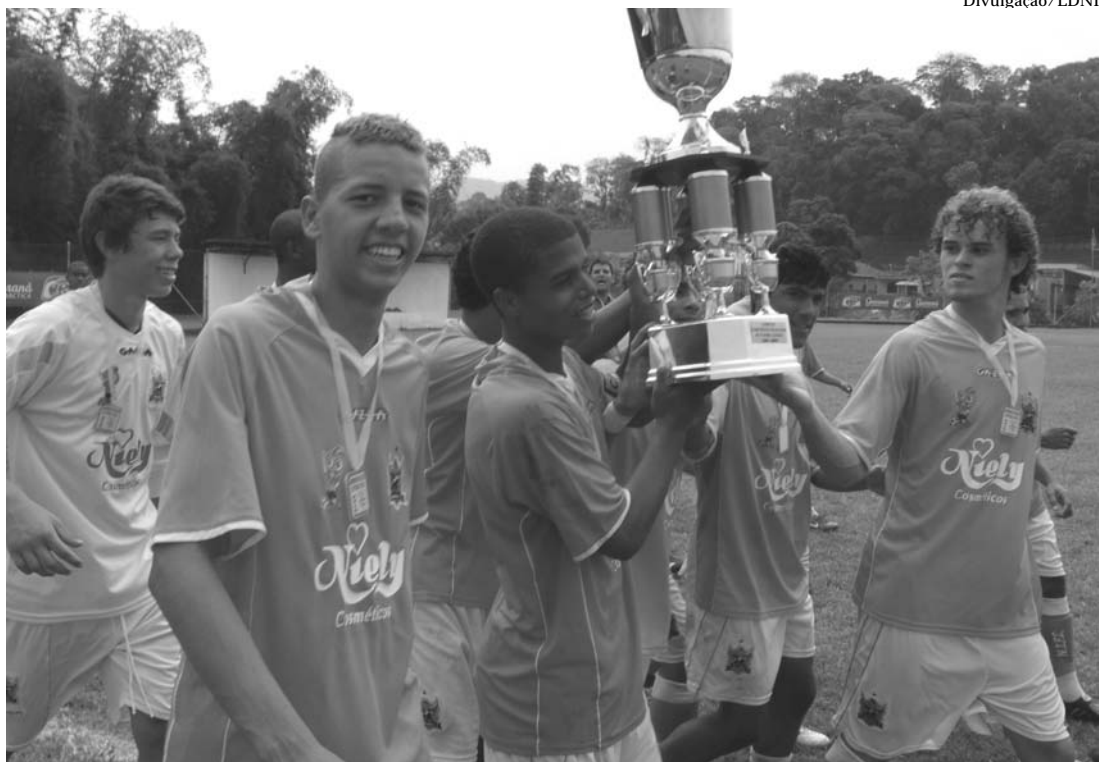
O Nova Iguaçu FC luta pelo bicampeonato Juvenil em 2011

A Liga de Desportos de Nova Iguaçu confirmou o início do Campeonato Juvenil e Infantil para este sábado, dia 7, com a realização das partidas válidas pela Chave A das duas categorias. O Nova Iguaçu FC, campeão em 2010, fará sua estreia em seu Centro de Treinamento, às 13 horas, diante do Pavunense. O Bayer recebe em seu campo, na cidade de Belford Roxo, a equipe do São Bento, de Duque de Caxias, e no Tatão, em Santa Eugênia, o Aliados terá pela frente o Costa Barros, às 13