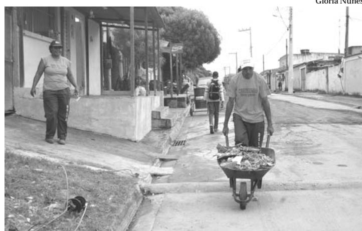
A Prefeitura esteve no Bairro Lagoinha na última quarta-feira, dia 4, para a realização de ações de manutenção, limpeza e infraestrutura

A Prefeitura de Nova Iguaçu está trabalhando para atender todos os bairros do município. Na última quarta-feira, dia 4, funcionários da Codeni (Companhia de Desenvolvimento de Nova Iguaçu), Semcid (Secretaria Municipal de Cidade) e Emlurb (Empresa Municipal de Limpeza Urbana) estiveram no Bairro Lagoinha, realizando ações de manutenção, limpeza e infraestrutura. Na Estrada da Lagoinha e na Rua Dois, uma equipe de 30 operários recuperou a rede de esgoto, reformou calçadas e restaurou parte das vias, com cerca de 40 toneladas de asfalto. Para o trabalho foram utilizados oito ceifadeiras, seis caminhões, uma retroescavadeira e uma miniescavadeira. A Prefeitura também acompanhou o trabalho da Light, que esteve no local para trocar um poste que ameaçava tombar.