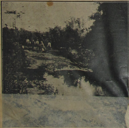
Photographia do local que liga a povoação do Brejo á Belfort-Rôxo antes da construcção de uma ponte

Si do povo sae o gozo do rico, si o povo é quem paga o bem