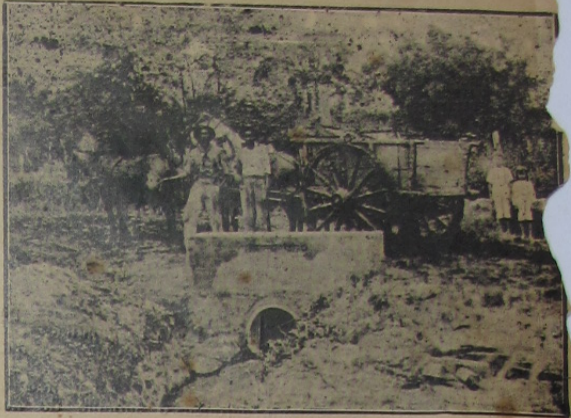
Photographia do mesmo local que liga a povoação de Brejo á Belfort-Rôxo depois da construcção de uma ponte

A Prefeitura tem empreendimentos a executar em todo o Municipio, os quaes só com o tempo poderão constituir-se em realidade, estando no momento presente o Sr. Dr. Prefeito occupado com o abastecimento d'agua, com a limpeza e saneamento da cidade e em Queimados, com a rede de esgottos e a limpeza biologica dos rios.