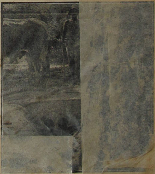
Photographia da rua Moquetá, em Nova Iguassú, mostrando a reconstrucção da ponte que a liga á mesma rua