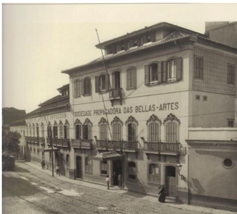
Figura 11- Liceu de Artes e Ofícios do Rio de Janeiro.