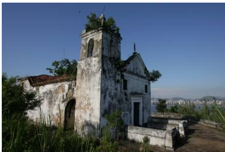
Figura 5- Igreja de Nossa Senhora da Boa Viagem

Disponível em: https://extra.globo.com/noticias/rio/prefeitura-de-niteroi-anuncia-reabertura-da-ilha-da-boa-viagem-no-proximo-dia-20-18664140.html . Acesso em: 03 de Novembro de 2020.