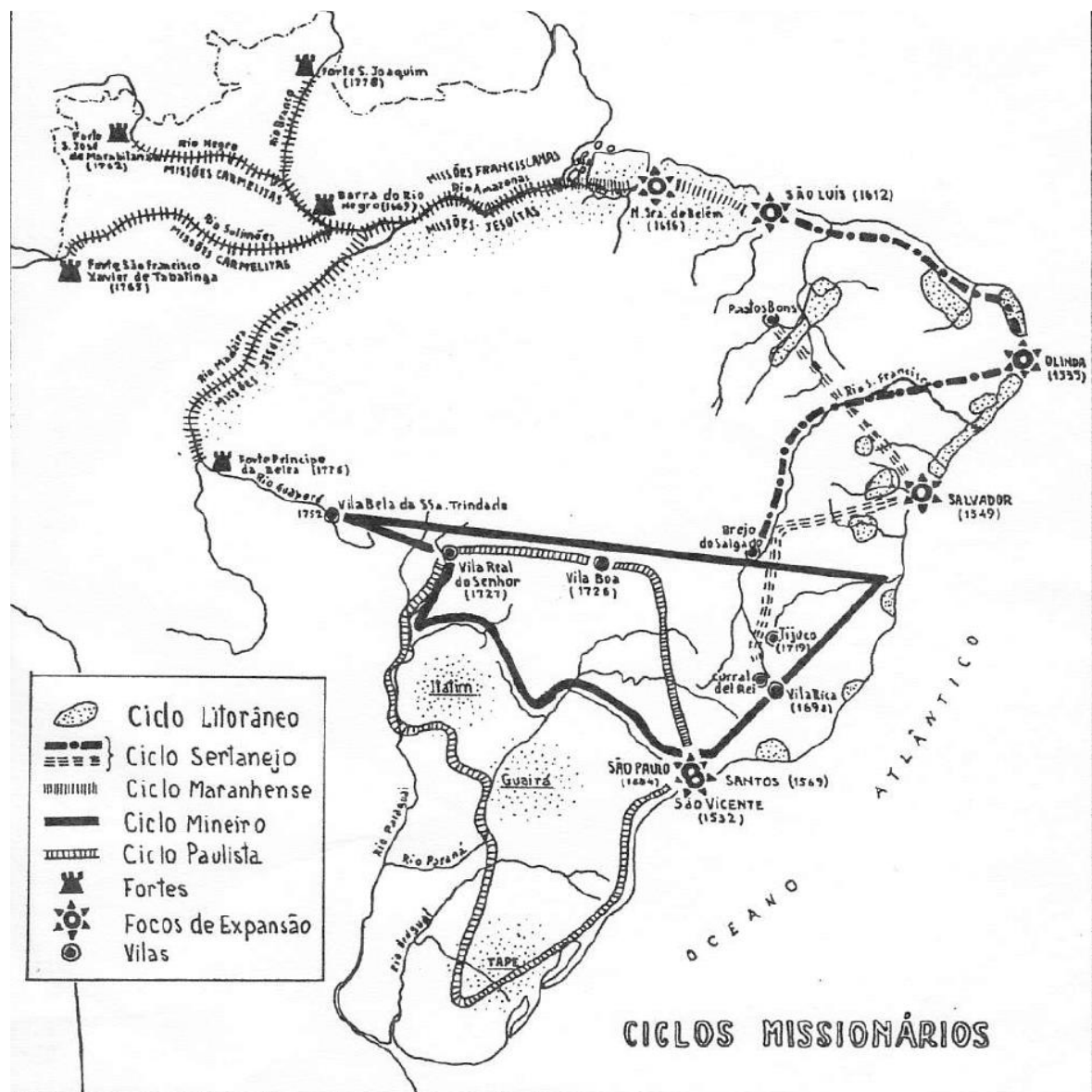
Figura 1- Ciclos Missionários.