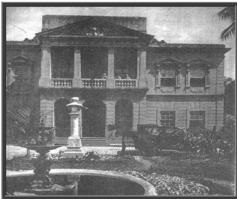
Figura 8- Asilo de Meninos Desvalidos/Instituto Profissional João Alfredo.

Acervo: MIS - pasta 127 Fotógrafo: Augusto Malta Data: 13/09/1927. Disponível em: http://livros01.livrosgratis.com.br/cp057713.pdf . Acesso em: 09 de Outubro de 2020.