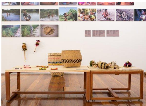
Figura 9: Um dos espaços da Exposição

Disponível em: www.images.app.goo.gl/J4B9Sout7WJPG4jQ9 . Acesso em 11 de Novembro de 2020.