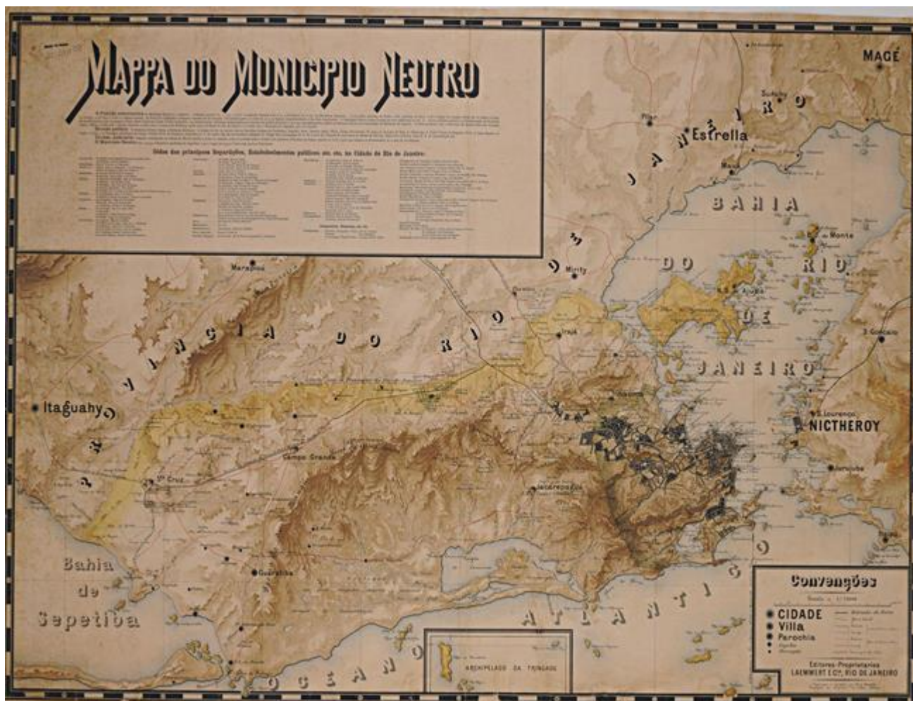
Figura 2- Mapa do Município Neutro do Rio de Janeiro