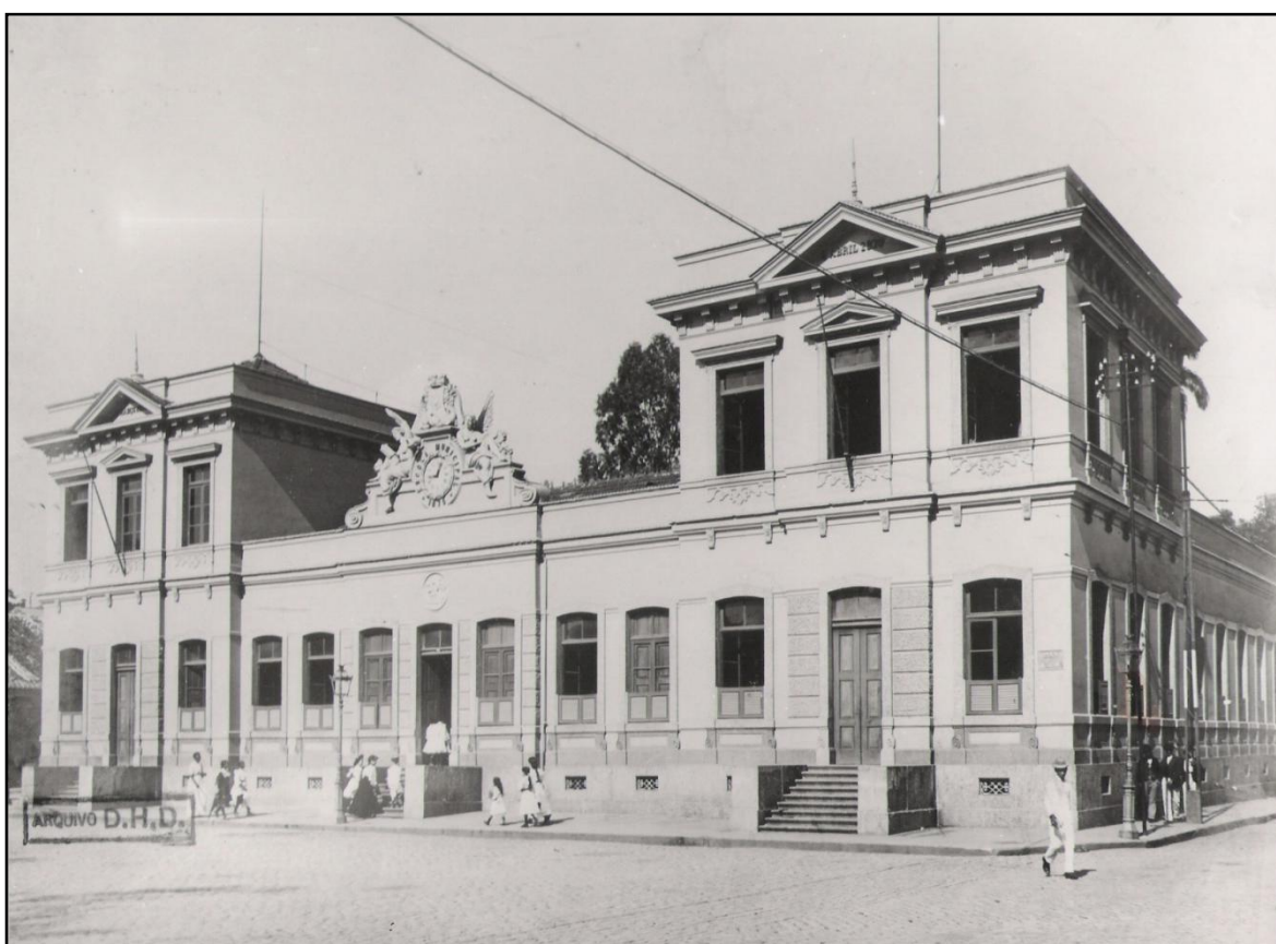
Figura 6- Escola da Freguesia de São Sebastião

“Situada na Freguesia de Sant’Anna, Praça Onze de Junho, entre as Ruas do Senador Eusébio e do Sabão. Fotografia do período republicano, com crianças negras [esquerda, em baixo] e brancas se dirigindo à entrada da escola. —A 7 de setembro de 1870 a Escola de São Sebastião teve a pedra angular assentada pelo Imperador, sendo inaugurada em 4 de agosto de 1872 [...] Seu frontão coroadado com as armas da cidade, possuía um mostrador de relógio engastado no tímpano.[...] Em 1897 a escola passou a ser Benjamin Constant, preterindo-se o santo guerreiro, padroeiro da cidade, a favor do militar positivista e líder republicano. Em 1938 ela foi demolida, com a abertura da avenida Presidente Vargas.¶ (Sisson: 1990, p. 64-5)” (Campos, José Carlos Peixoto de. 2010, p. 184)