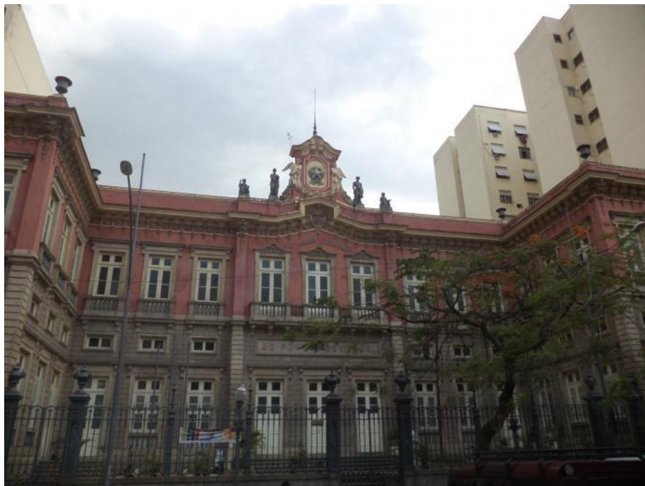
Figura 7- Atual Colégio Estadual Amaro Cavalcanti.

Disponível em: http://wikimapia.org/219350/pt/Col%C3%A9gio-Estadual-Amaro-Cavalcanti-CEAC . Acesso em: 09 de Outubro de 2020.