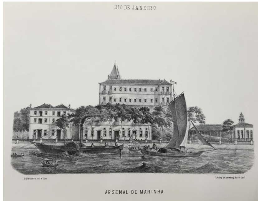
Figura 3- Arsenal de Marinha em 1846